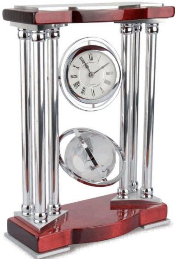
ref. Z-472 RELOJ COLUMNA MADERA NOBLE

1 • 25x18x8 cm 10 • Incluye placa para grabación