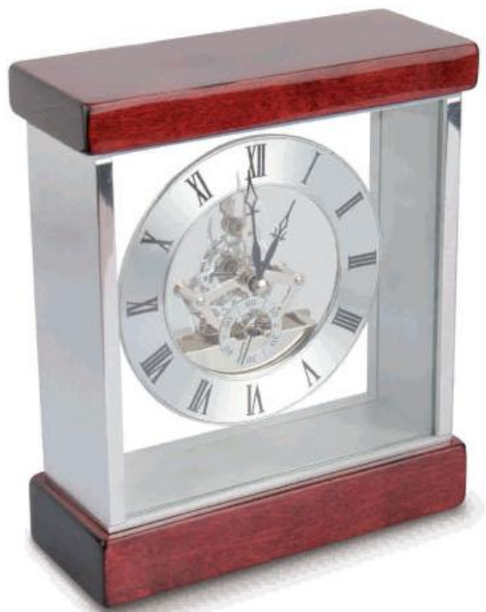
ref. Z-470 RELOJ LUXE MADERA NOBLE

uds/€ -100 61,2 | 100 59,5 | 300 59,2 500 55 | 1000 52,8 | 3000 51,9