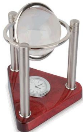
ref. Z-471 RELOJ BOLA CRISTAL Y MADERA

1 • 14x10x11 cm 6 • Incluye placa para grabación